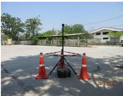
ตรวจวัดคุณภาพเสียง