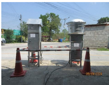
ตรวจวัดคุณภาพอากาศ