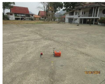
ตรวจวัดความั่นสะเทือน

หากต้องการสอบถามข้อมูลเพิ่มเติมสามารถสอบถามได้ที่